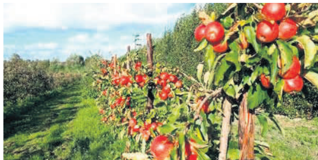
Tåsinge Æblefestival holdes i år fra 11. - 20. oktober.

Deltagerne kan opleve pæreskuderne ankomme og afgå fra havnen i Troense. Og man kan igen spørge skipperen, om man må komme med og give en hjælpende hånd. Der er lejlighed til at